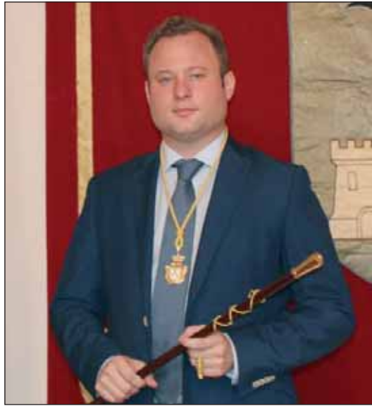
Vicente Casañ Alcalde de Albacete

Del 7 al 17 de septiembre Albacete se convierte en la capital mundial de la tauromaquia, y lo hace por méritos propios: la seriedad del toro de Albacete, la comparecencia de las grandes figuras, la presencia de los toreros emergentes y el protagonismo de los espadas locales.