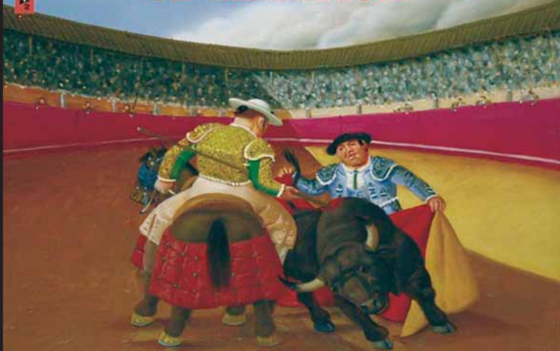
Ilustración por el artista Francisco Romero para esta Feria