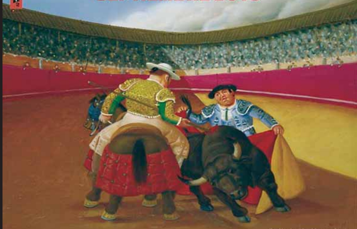
Ilustración por el artista Francisco Romero para esta feria